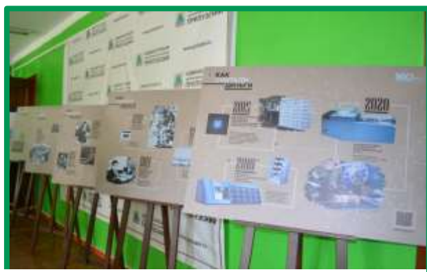
Выставка Банка России «Время и деньги», «Как считали деньги» и «Как защищали деньги»