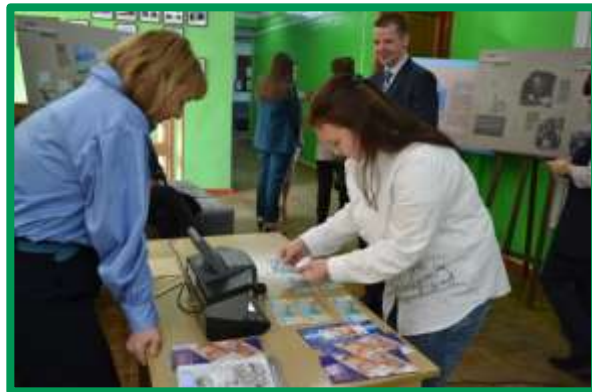
Мастер-класс по определению подлинности банкнот Банка России